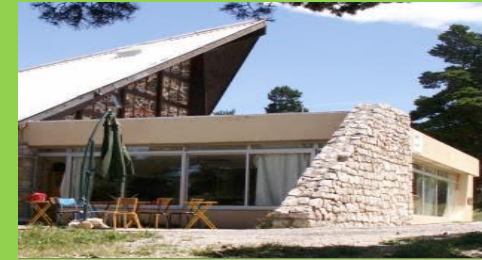
Centre de Vacances le Dahut

Du Lundi 17 Juillet au Vendredi 21 Juillet 2023