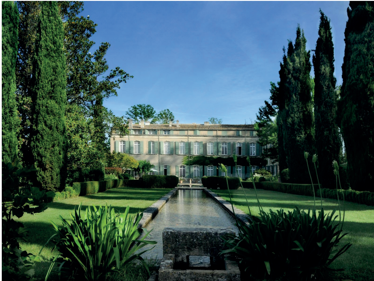
Château de Brantes, Sorgues