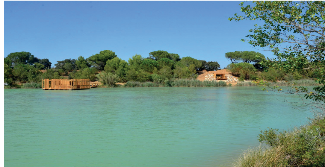
Lac de la Lionne, Sorgues